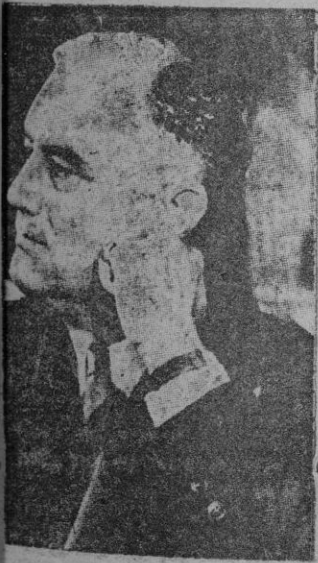
Roosevelt, cuyo mensaje se ha contestado mañana por Hitler

La voz y una fecha. La voz de Roosevelt; la fecha, la del 28 de Abril. Cuando pendiente de ellas, porque el Reichstag, el Canciller alemán estará al mensaje de Roosevelt. La contestación puede consolidar la paz tan amenazada estos días, o de adenanar la guerra, que con tanto interés buscan los enemigos conciliables de los Estados totales.