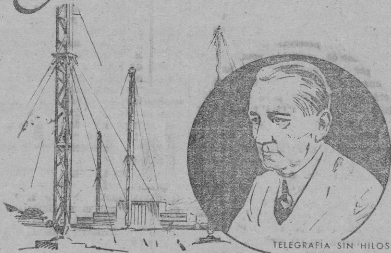
TELEGRAFIA SIN HILOS INVENTOR: MARCONI 1874-1937

Todos los grandes inventos son fruto de ideas luminosas.. Existen en el universo materias y energías, que utilizadas con el acierto de una feliz idea producen efectos asombrosos. He aquí el secreto de la INSTANTINA, combinación especial de eficacísimos elementos terapéuticos, inocuos y seguros, que cortan con la máxima rapidez los resfriados y sus consecuencias así como toda clase de dolores.