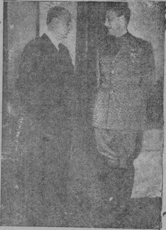
El Conde Ciano y el Ministro de Negocios Extranjeros de Yugoslavia, en su reunión de Venecia, en la que se ha reforzado la amistad italo-yugoeslava y lograda la aproximación de Belgrado al eje Roma-Berlin

ber llegado al término de su alucinante tragedia. Las penalidades pasadas han sido tan terribles, que han dejado huellas impresionantes en los rostros demacrados y doloridos. Ya no es la depauperación, los efectos de la avitaminosis. Es el atroz suprimiento moral, la angustia de una inquietud constante, abrumadora. Son rostros apergaminados, vencidos por la tris-