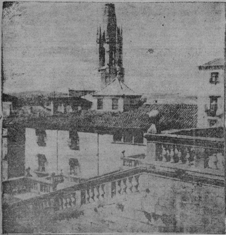
La Catedral de Gerona

GERONA, es de España. ¡VIVA FRANCO! ¡VIVA EL EJERCITO ESPAÑOL! ¡ARRIBA ESPAÑA! ¡VIVA ESPAÑA!