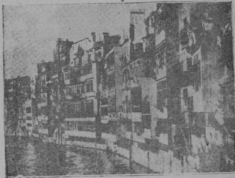
Un aspecto de la ciudad de Gerona, bañada por el río Oñar