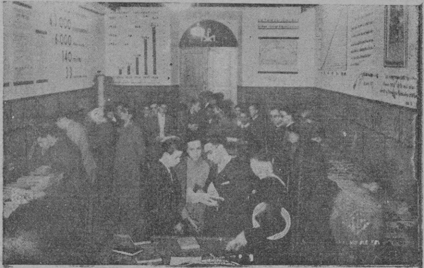
La Exposición de la Prensa de Congregaciones Marianas

Naturalmente, de todo ello se aprovecha el Komintern, que ha puesto también allí su garra, creando sus órganos para la revolución bolchevique. Y es sabido que Moscú se erige en defensor de la democracia en las demás naciones, y pregona pretendidas excelencias de una tal libertad, que desterró en el país soviético, donde impera la más feroz de las tiranías. Pero, mientras tanto, al socaire de esa defensa liberal, procura ayuda para los rojos españoles y su última maniobra tiende a lograr que se rompa aquella Ley de neutralidad, que sólo al Comité soviético que preside el nefasto Negrin podría favorecer. La maniobra se ha llevado al Congreso; pero hasta hoy no ha logrado el resultado que esperaban los intrigantes. Esperemos que Roosevelt impedirá, por decencia y prestigio de aquella nación, que su Patria quede sometida a la tiranía soviética de la cual ya vemos cuanto le cuesta a Francia librarse de ella a pesar de los esfuerzos de Daladier.