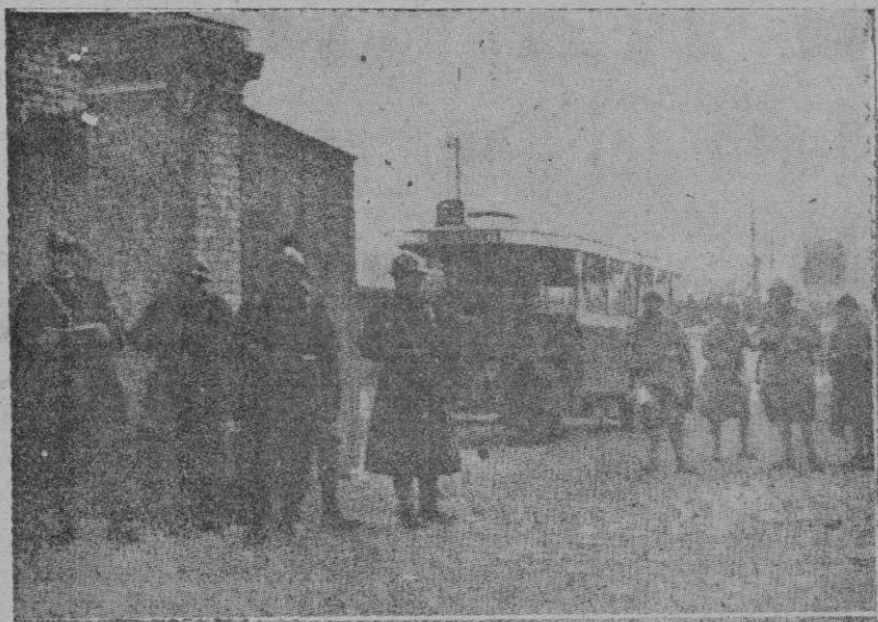
Soldados custodiando las cocheras de los autobuses, el día de la fracasada huelga general, en París

ner remedio al mal, y retirarse de España, dejando en libertad a las poblaciones que se acojan a la justicia y magnanimidad del Generalísimo.