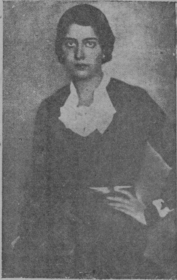
La princesa María de Saboya, hija menor de los Reyes de Italia, que contraerá matrimonio con el príncipe Luis Carlos María Leopoldo de Borbón-Parma

Mientras nosotros proclamamos con júbilo nuestra rotunda victoria, ellos muerden el polvo de la derrota. Su suerte está echada. Al fervor de nuestro entusiasmo, ellos sólo pueden oponer el pavor de su hecatombe, que hace temblar a los capitostes del marxismo, porque la paciencia de la población sojuzgada por la tralla rusa puede tener término. La desmoralización es enorme en la zona marxista. El partido comunista redobla sus ataques contra Negrin, personificación de tantos desastres y de todos los descréditos. Ahora, de nuevo, las detenciones, hasta de milicianos, hasta de jefes y oficiales, mientras las manifestaciones públicas contra el gobierno van asomándose a las calles. Es que no pueden engañar más ya a sus masas, y los gritos de este júbilo nuestro, tan justo y tan esperado, en la confianza rotunda de la Es-