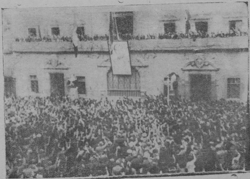
Aspecto que ofrecía la plaza de Cort al caer de la tarde del sábado, en que Palma exteriorizó su júbilo y entusiasmo por la toma de Vinaroz y Benicarló