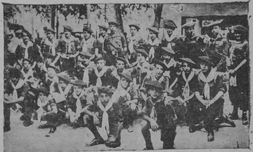
Grupo de Flechas de Mallorca, que embarcaron el domingo invitados por el Duce, para pasar una temporada en las colonias infantiles de Italia