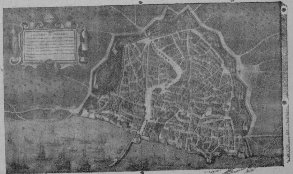
Antiguo puerto de Palma

Como muestra de la configuración del antiguo puerto, reproducimos a continuación el grabado de la figura