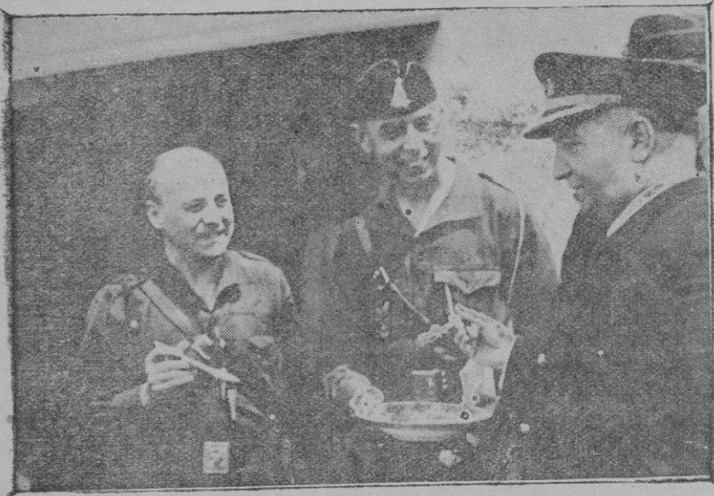
Inauguración de los Comedores de «Auxilio de Invierno», en el «Unión». — El Comandante de la Base Naval de Baleares y el Jefe de Falange Española Tradicionalista y de las JONS, en el momento de probar la paella que fué servida a los Flechas. Les sirvió el Jefe Provincial de Flechas Sr. Rosselló.

La obra meritoria de Auxilio de Invierno encontrará a no dudar, el apoyo del pueblo de Palma, ya que con ella se ha de aliviar de manera notable la situación de los niños pobres, desamparados y enfermos.