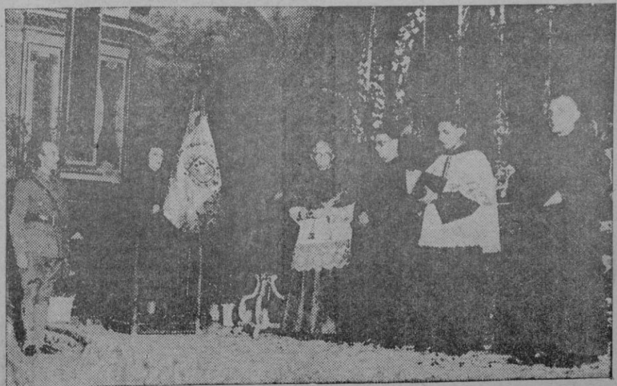
El altar mayor de la iglesia de San Francisco durante la bendición de la bandera de los Requetés