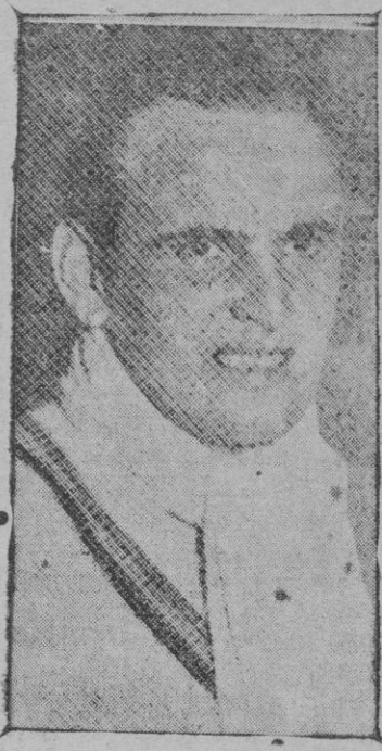
El campeonato mundial de tennis, jugado en Inglaterra, ha sido ganado por el alemán Kleslein, que venció al francés Cochet

Para final de fiesta se disparará una kilométrica traca.