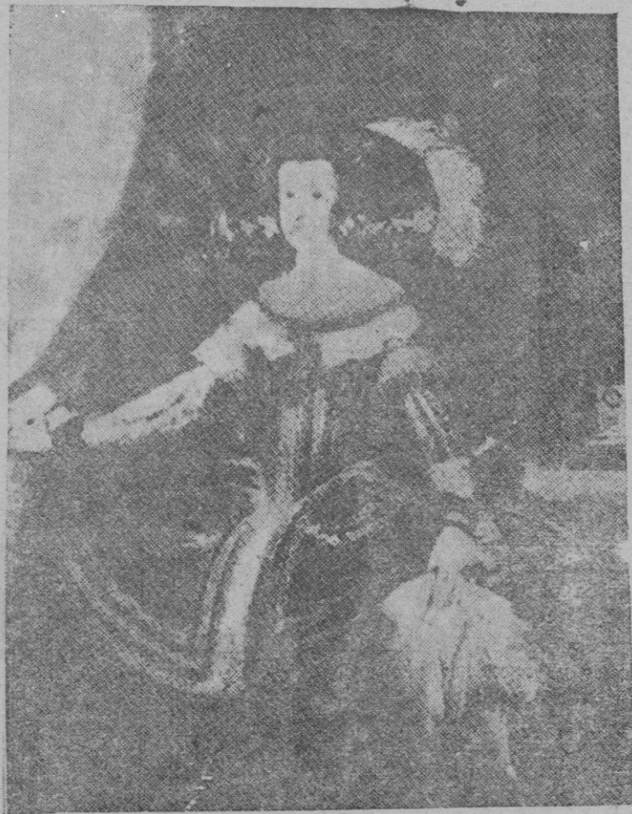
Este retrato de Mariana de Austria, segunda esposa de Felipe IV, que pintó el genio de Velázquez, ha sido vendido recientemente en Londres, en subasta pública, en suma de 5.880 libras esterlinas (unas 200.000 pesetas).

Los juegos florales de la sociedad valencianista continúan en marcha triunfal. Este año también se celebrarán con su tradicional esplendor en el teatro Principal, y nuevamente la hermosa trilogía de «Fe, Patria y Amor», volverá a ser glosada con ardoroso entusiasmo de nuestros poetas, a pesar de que los tiempos se