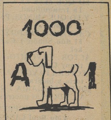
Jugador del Real Madrid.