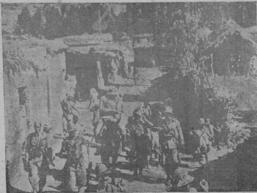
Destacamentos de las avanzadas italianas, ocupando una población a bisinla