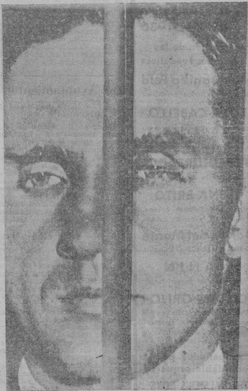
Una de las más recientes fotografías de Hauptmann detrás de la reja de la cárcel, donde ha estado esperando la terrible pena.

Con al representación proporcional por cada cantidad de votos que determina el censo, y el número de votantes, corresponde un concejal. Y cada partido logra los que debe alcanzar según su fuerza política.