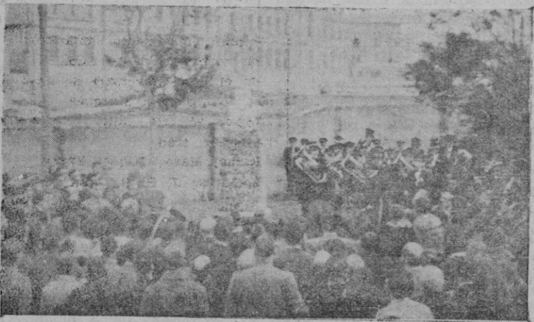
El descubrimiento del busto de Nicolau en el Velódromo

San Miguel 32 y 34 - Tel. 1719 PALMA DE MALLORCA