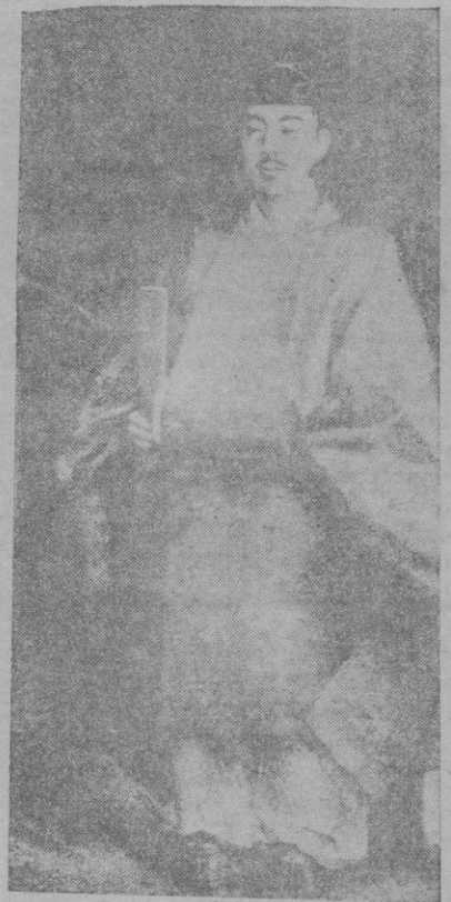
Hiro Hito, emperador del Japón