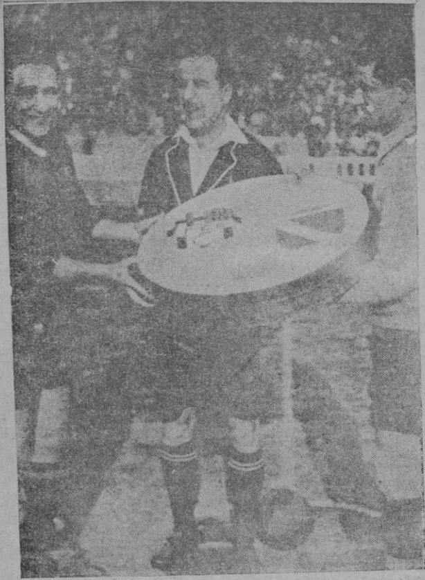
Momento en que el capitán del "Mallorca" entrega al del "Barcelona" una ensaimada, en cuya caja aparecen dibujados los escudos de los equipos contendientes