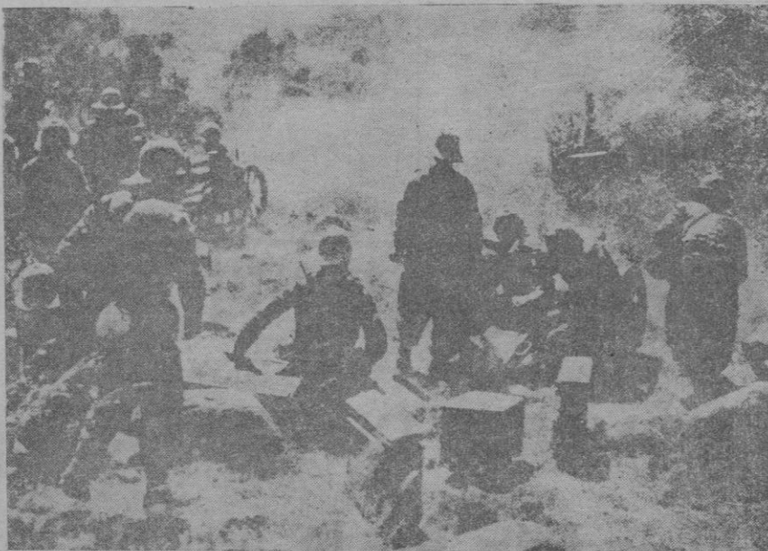
La artillería italiana, despliega toda su actividad en la toma de Ambar Aradam