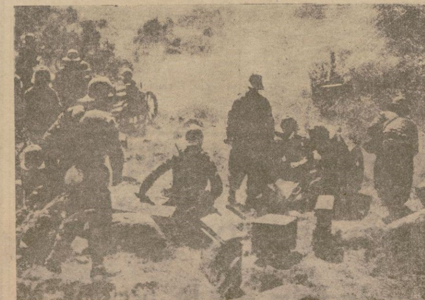
La artillería italiana, despliega toda su actividad en la toma de Ambar Aradam