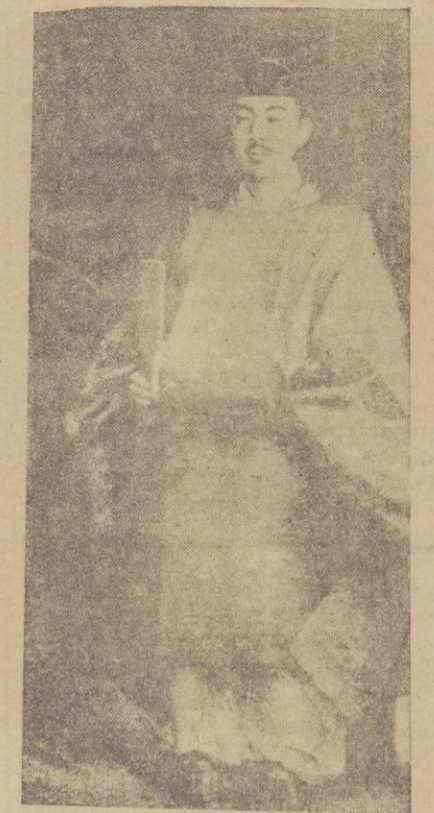
Hiro Hito, emperador del Japón