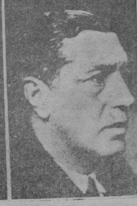
Don Plácido Alvarez Buylla, Ministro de Industria y Comercio