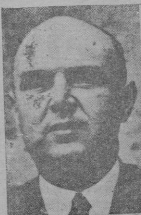
D. Mariano Ruiz Funes, Ministro de Agricultura