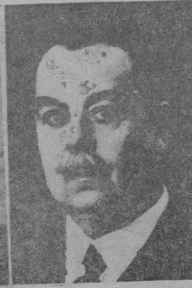
Don Manuel Blasco Garzón, Ministro de Comunicaciones