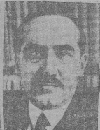
D. Amós Salvador, Ministro de la Gobernación