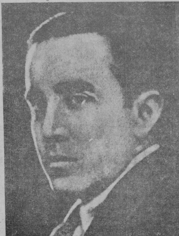
D. Miguel Mariano Gómez Arias, que ha sido elegido presidente de la República de Cuba

nan los vientos del S. y la mar llaña o rizada.