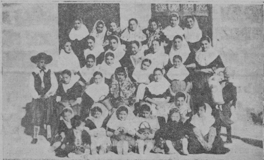
Grupo de señoritas que tomaron parte en la adoración el día de Reyes en el Sagrado Corazón, del Ensanche