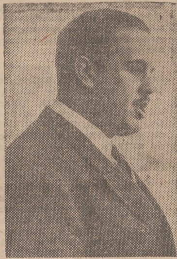
JOSE ANTONIO GIRÓN, ministro de Trabajo

Enumeró a continuación otras consignas, referidas a la libertad