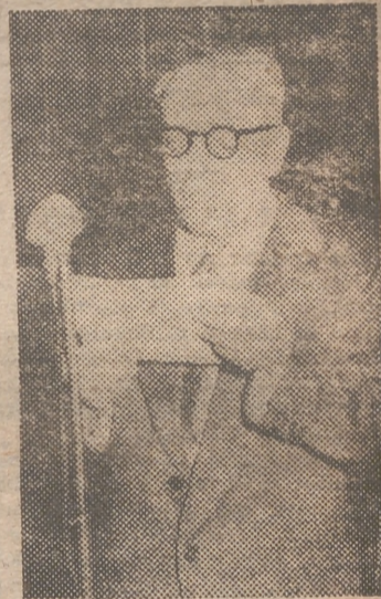
El doctor alicantino Mas y Magro, famoso por sus trabajos sobre la Leucemia, doó, ayer tarde, una conferencia en el Cursillo de Enfermedades Infecciosas, organizado por la Delegación Provincial de Sanidad del Movimiento. En tercera página publicamos una breve entrevista con el ilustre conferenciante, sobre el apasionante tema de su especialidad.