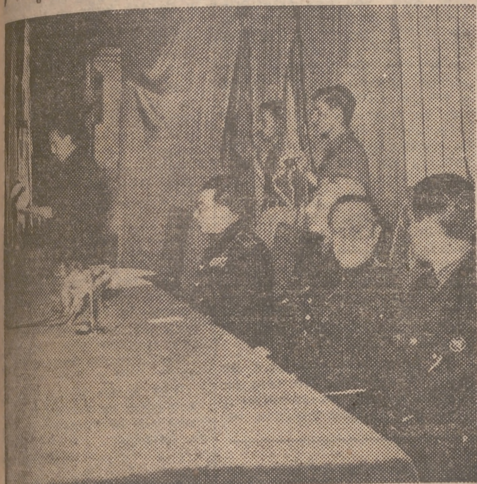
MADRID. — Un momento del acto inaugural del X Congreso Nacional del Frente de Juventudes, que fué presidido por el ministro Secretario General del Movimiento, delegado nacional del Frente de Juventudes y otras jerarquías

Inauguración del X Consejo Nacional del F. de J.