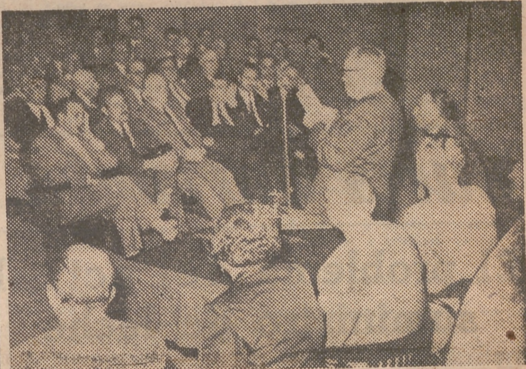
Un aspecto del salón de actos de la C. N. S., durante la conferencia de Mas y Magro.

Después de atendido ha sido trasladado al sanatorio del doctor Borrás.