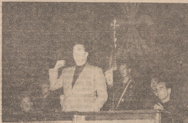
El jefe provincial se dirige a los assembleístas de la comarca de Torrente.

Pronunció un magnífico discurso, el jefe provincial