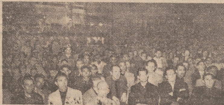
Aspecto que ofrecía el Parque de Torrente, en el acto de la Asamblea Comarcal del Movimiento, celebrado el sábado

El pasado sábado, por la noche, se celebró en esta población, como estaba anunciado, la Asamblea Comarcal del Movimiento, presidida por el jefe provincial y gobernador civil, don Diego Salas Pombo.