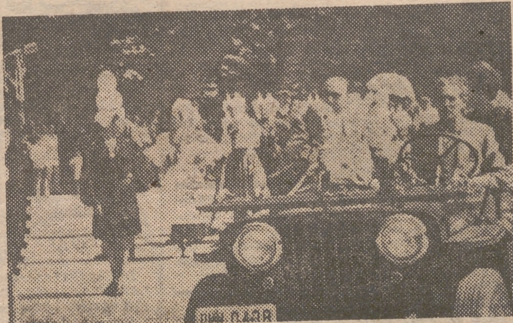
MADRID. — La gran cabalgata, anunciadora de la Feria Internacional del Campo, constituyó un memorable éxito que fué corroborado por los aplausos del numeroso público que la presenciaba a lo largo de las calles de la capital. El director general de Prensa, ocupando un "jeep", durante la misa celebrada en el Retiro para los participantes de la cabalgata.