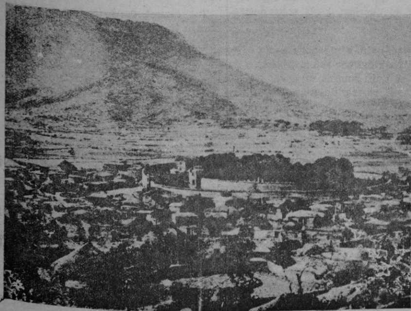
Vista de Adua. — En el centro, la iglesia del Redentor