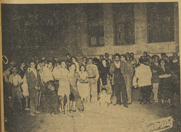
En la puerta del Hospital se congregaron numerosas personas para esperar, con ansiedad, noticias sobre el estado de los heridos en la catástrofe