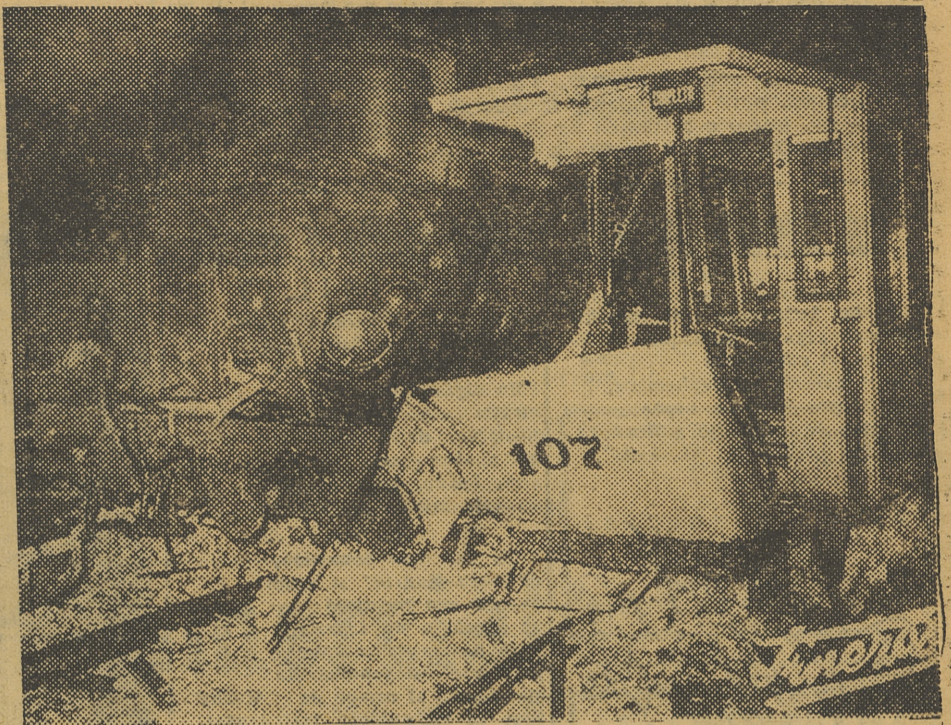
Dos aspectos de la situación en que quedaron la locomotora y el remolque del tranvía, después del choque que se produjo en el paso a nivel de Mislata.