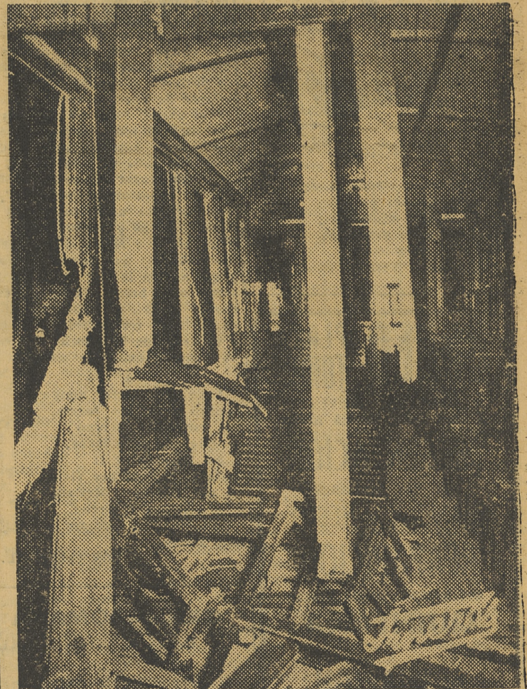
Interior del remolque. Pueden apreciarse, en la foto, los destrozos que sufrió el tranvía en el trágico suceso