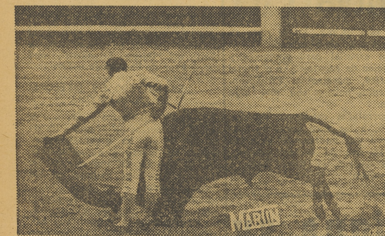
El mexicano Jesús Córdoba, muestra la esplendidez de su arte en la ejecución de este natural, bello exponente del exquisito toreo del diestro

Cunde la animación alrededor del gran festejo taurino que ha de celebrarse el próximo domingo. La afición taurina ha recibido con patente satisfacción el cartel de la corrida de la prensa. Y es que la reparación de Jaime Marco "El Choni", el torero de la calle de Sagunto, que ha ocupado y sigue ocupando un lugar preferente en la torería; la reposición de Calerito, el triunfador en nuestra feria y en muchas plazas, y el debut del torero mexicano Jesús Córdoba, uno de los mejores diestros americanos, hace que el espectáculo ofrezca la mayor atracción.