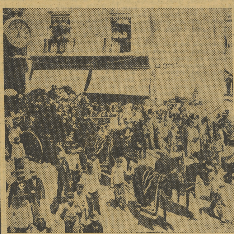
El entierro de Lagartijo

Este caso es muy conocido, porque los periódicos alborotaron el ambiente taurino refiriéndolo con toda clase de de-