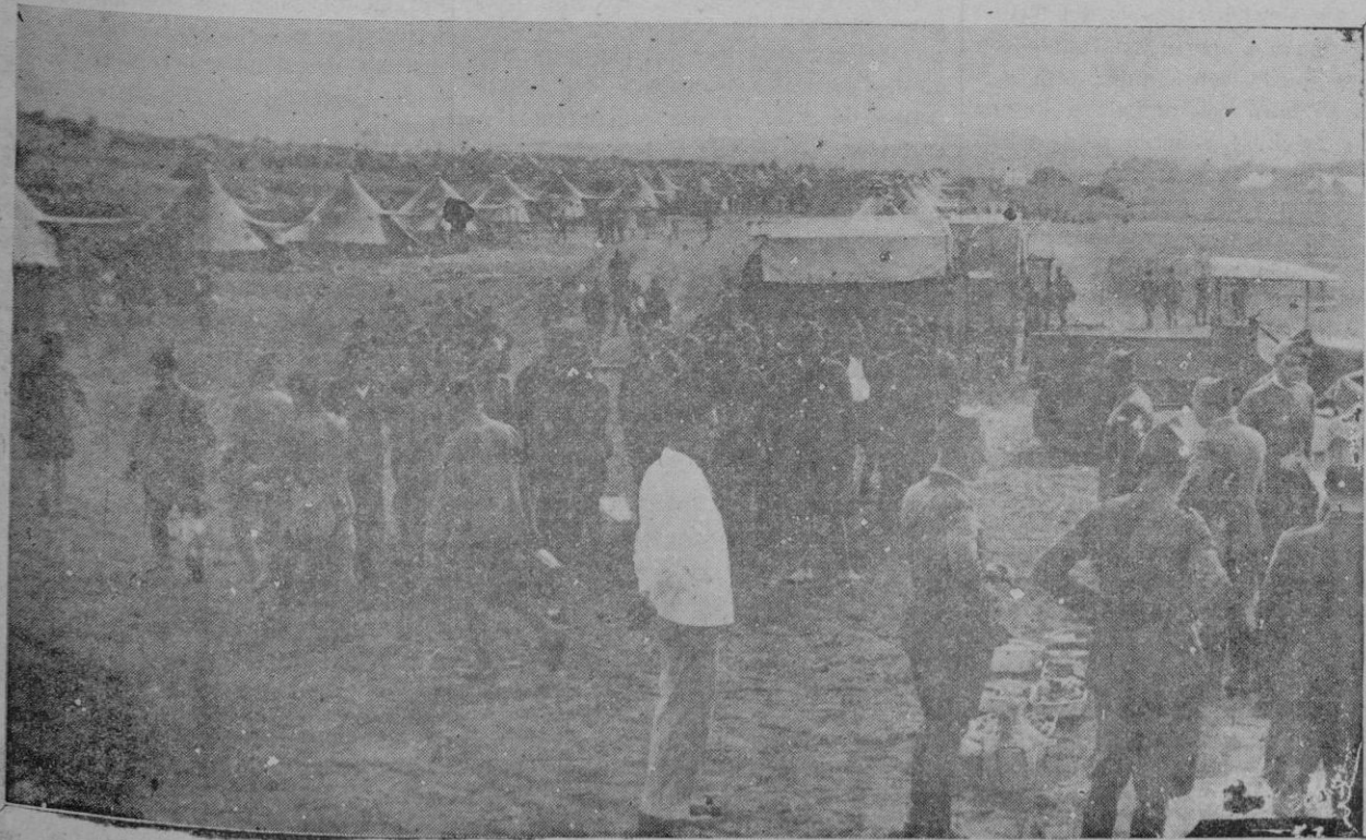
De las maniobras militares en Son Serra de la Marina, celebradas ayer. — La tropa en el campamento después de las maniobras, en el momento del rancho