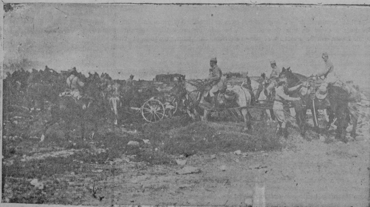
La artillería de montaña, llegando a la playa de Son Serra de la Marina, preparándose para actuar