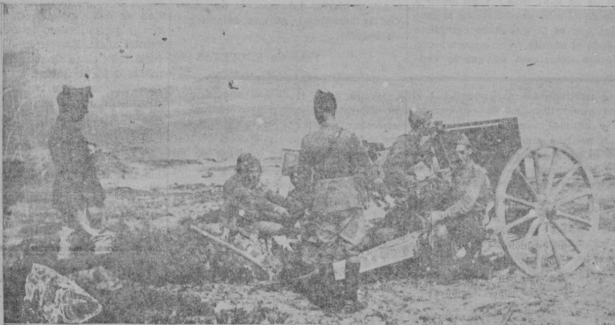
De las maniobras militares en Son Serra de la Marina, celebradas ayer. — Una pieza de artillería preparada para disparar sobre el supuesto enemigo