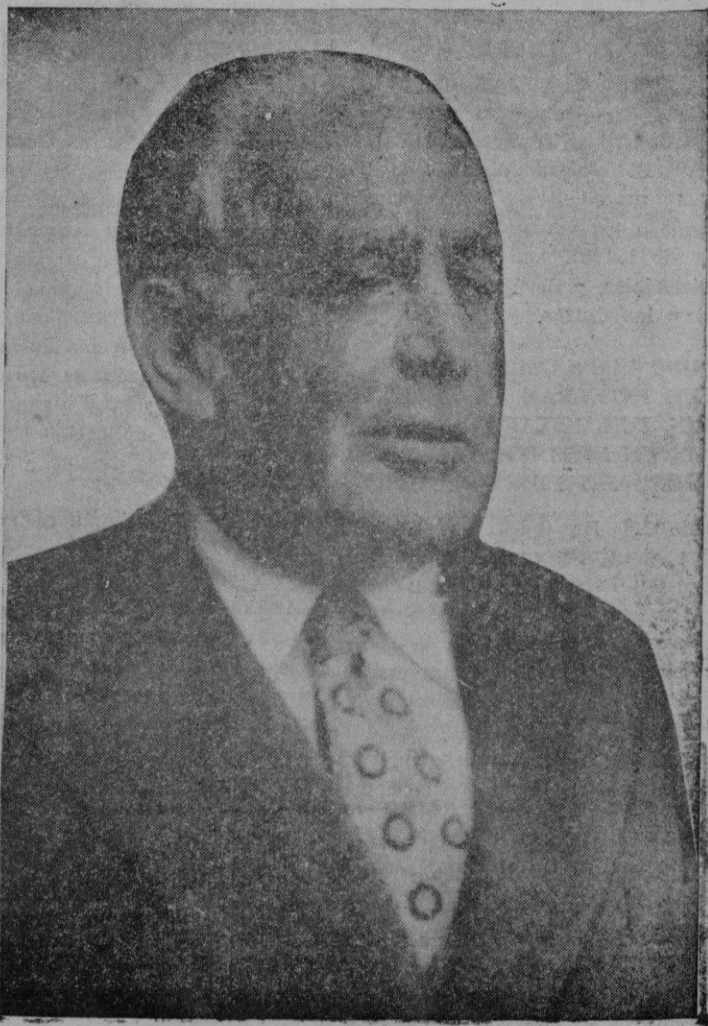
El Sr. Chapaprieta, jefe del Gobierno, cuya labor en el Ministerio de Hacienda le ha dado una popularidad y labrado una simpatía raras veces lagradas por un ministro