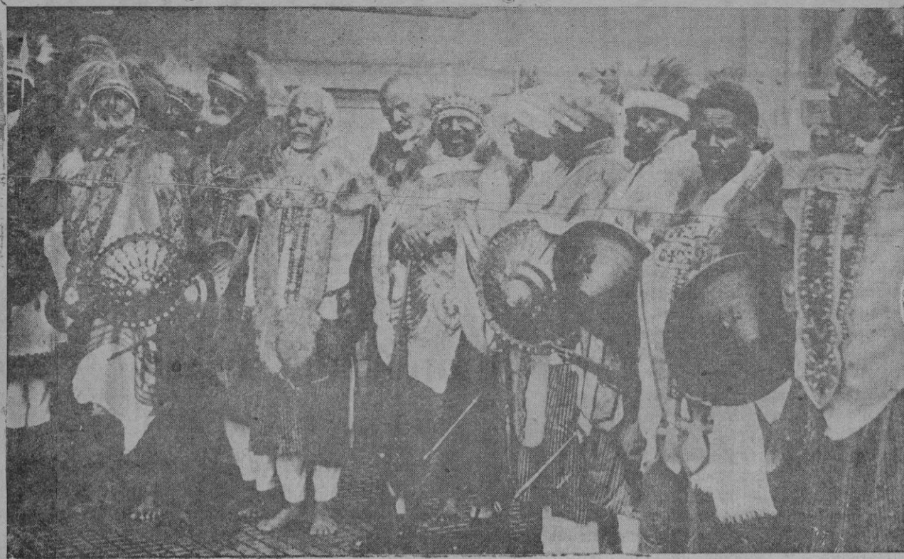
Una comisión de jefes de tribus de Abisinia que han ido a Addis Abeba, para ofrecer su apoyo al emperador