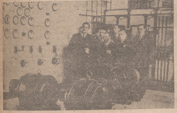
SEVILLA.—El ministro de Trabajo, don José Antonio Girón, durante su visita a la Escuela de Peritos Industriales de esta ciudad.