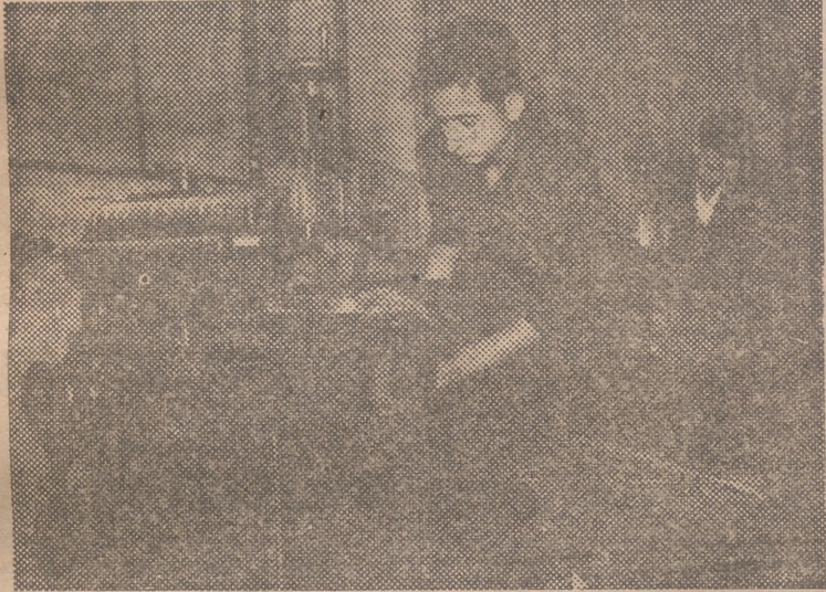
Ayer, por la mañana, dieron comienzo las pruebas del V Concurso