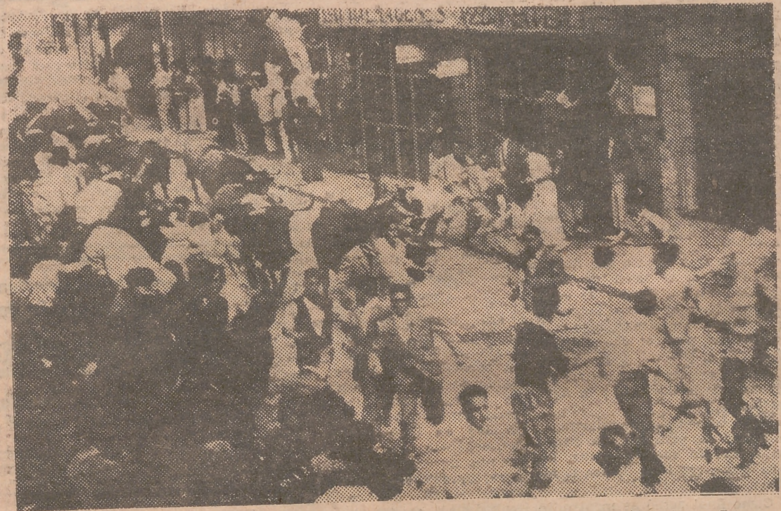
He aquí uno de los típicos y emocionantes encierros de las fiestas de San Fermín, en Pamplona. Los mozos corren delante de los toros que se van a lidiar por la tarde. Hay sustos, los revolcones y algún que otro disgusto serio. Pero los pamplonicos seguirán desafiando a las reses bravas a cuerpo limpio.