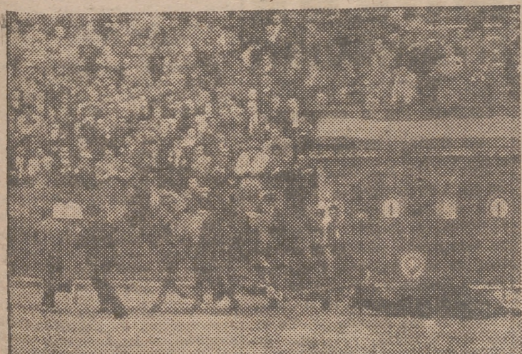
Las mulillas dan la vuelta al ruedo al cuarto novillo

Señores aficionados, Esperamos su opinión.