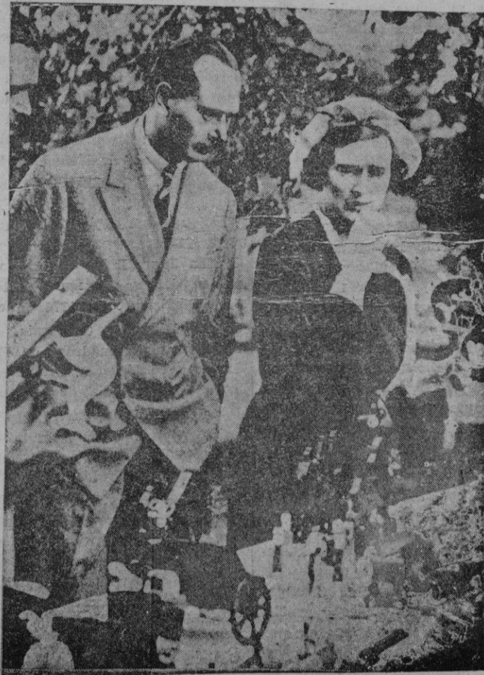
El duque de Gloucester, tercer hijo de los reyes de Inglaterra, junto a su prometida, lady Alice Montagu-Douglas-Scott, hermana de los duques de Buccleuch y Queensberry

Enterado el Alcalde de un suceso publicado por "La Última Hora" en