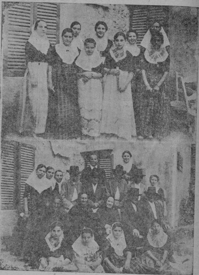
Grupo de ancianos más que octogenarios, con graciosas "payesas" que les acompañaron, homenajeados en la fiesta mayor de San Juan

Se gratificará su devolución en esta Administración.