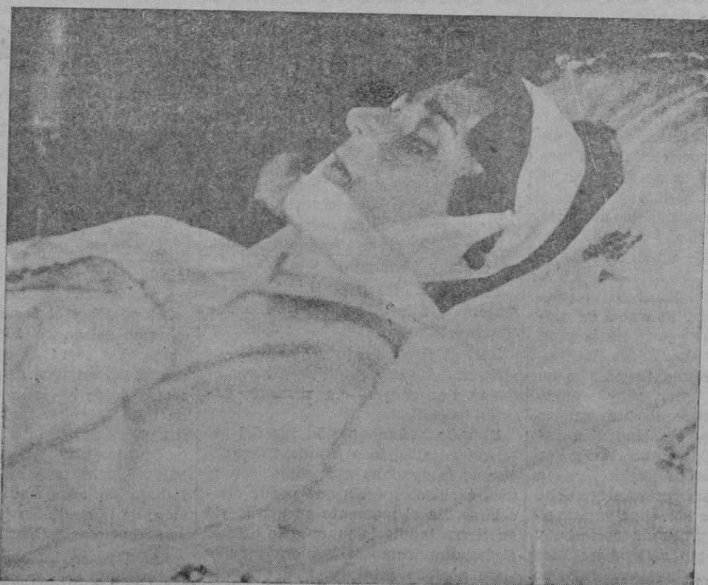
El cuerpo de la Reina de Bélgica, en la capilla ardiente