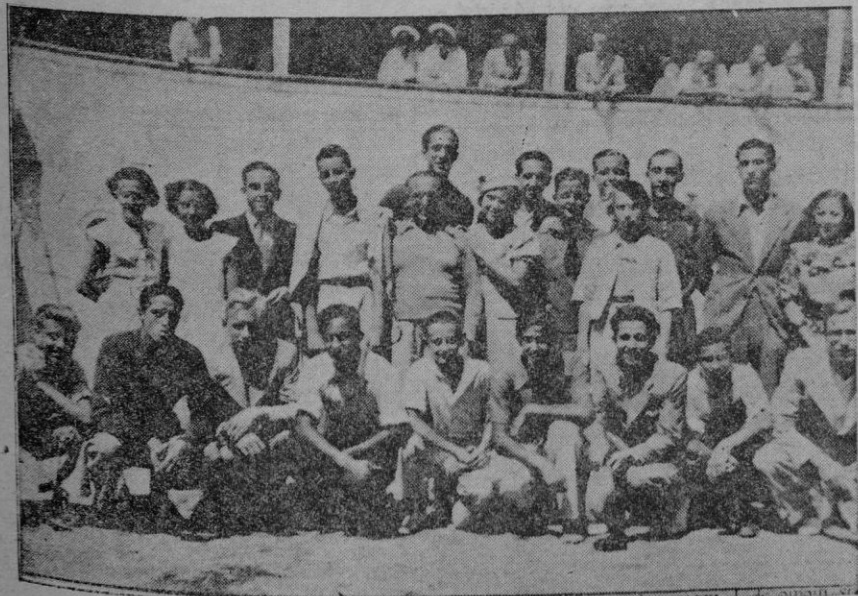
Nuestros nadadores, antes de partir ayer para Valencia, con objeto de tomar parte en el campeonato

Y con los correspondientes hurras al vencedor y campeón de la competición, C. D. Binisalem, el árbitro señala el final.