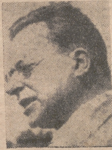
TOGLIATTI Algo huele a podrido...

la primera depuración, los no comunistas son expulsados, encarcelados o muertos, etapa de Marsaryk y Benes, y entran a gobernar los comunistas nacionales: Gottwald y Clementis. Pero después, éstos se hacen sospechosos, no son bastante fieles a Moscú y pueden tener tendencias «desviacionistas». Y viene la sustitución por otros completamente fieles a Moscú, comunistas sin más patria que Rusia, o incluso, como ocurre en Polonia por verdaderos rusos, Clementis huyó, o es asesinado, y Gottwald es estrechamente vigilado, ya que en todas estas etapas reina la ley del Talión. Para