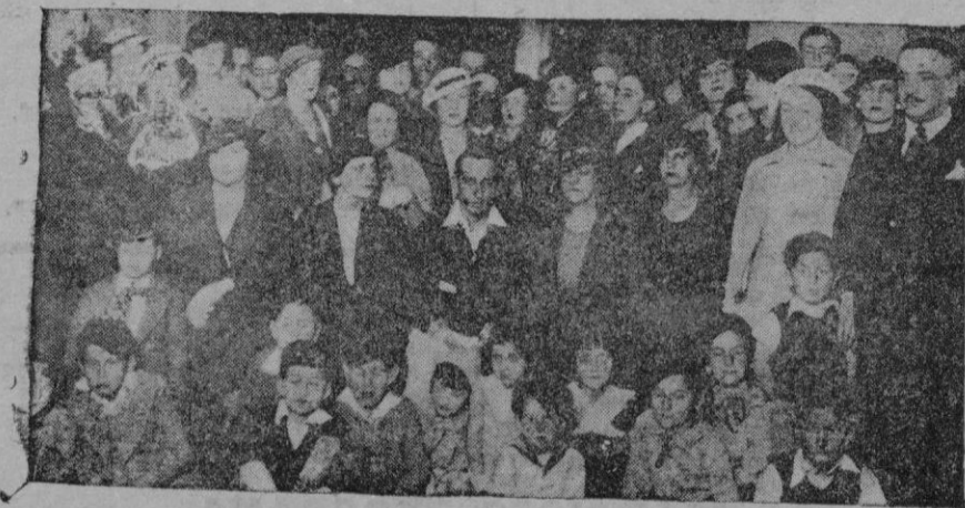
El aviador Pombo, a su llegada a Bogotá (Colombia), rodeado de los miembros de la colonia española

Conforme estaba anunciado en el programa de festejos al titular San Roque, jueves día 15, primer día de fiesta a las nueve de la mañana tuvo lugar en el Salón de Actos del Ayuntamiento la entrega a cada una de las familias meneserosas de esta localidad, unas cuarenta, la cantidad de diez pesetas, ob-