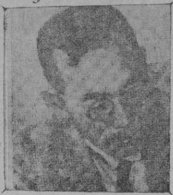
El general Nagata, del Ejército japonés, ha sido asesinado por el teniente coronel Aizawa

Por el indicado servicio Médico Escolar fueron tallados y pesados acusando esta operación un excelente resultado.