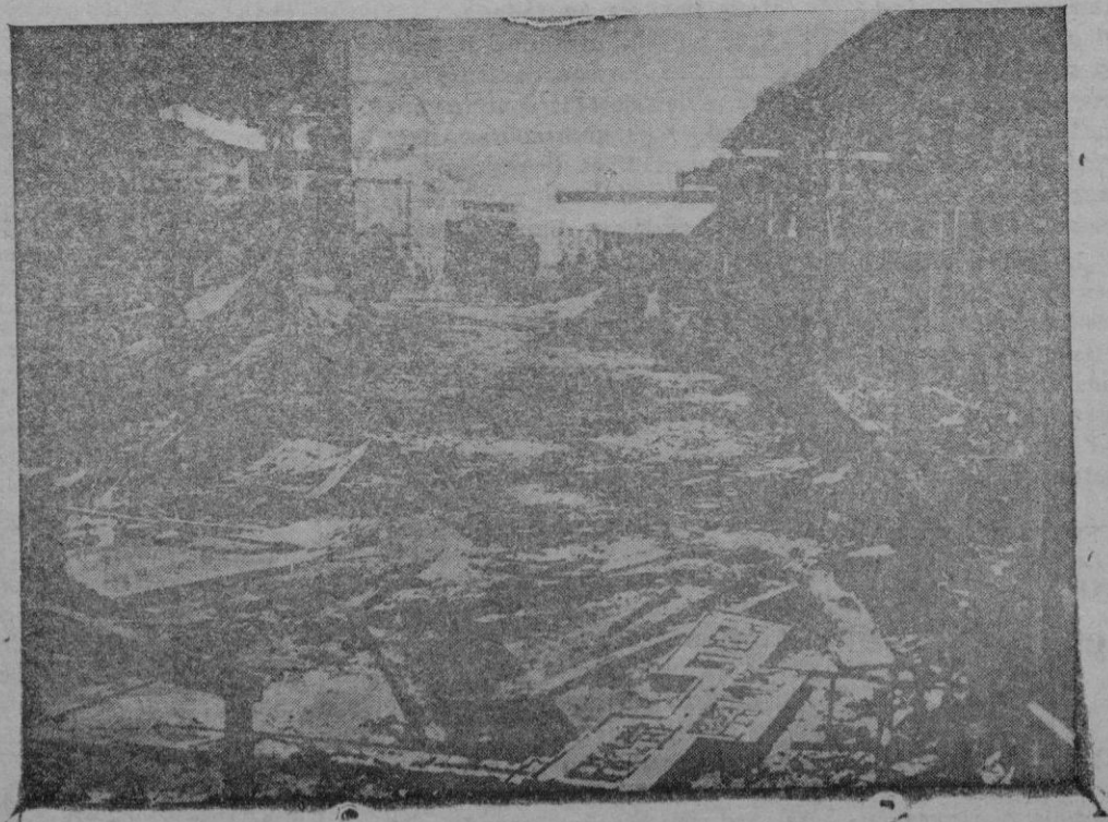
Una parte de la Exposición de Bruselas, destruida por un incendio

Como presunt autor de la agresión fué puesto a disposición del Juzgado.