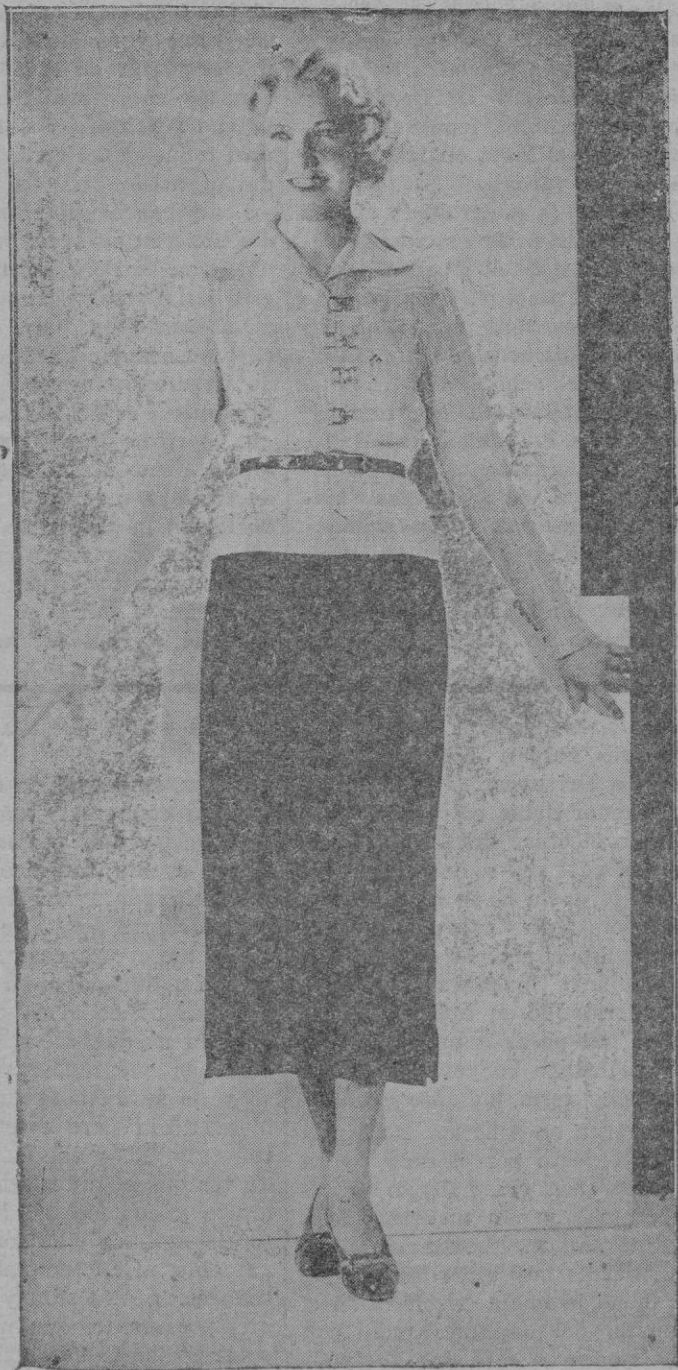
La moda. — Falda de lana y blusa color mostaza, que lucirá Una Merkel en una nueva película de la Metro-Goldwyn-Mayer. El cinturón y demás accesorios son negros, para hacer juego con el conjunto