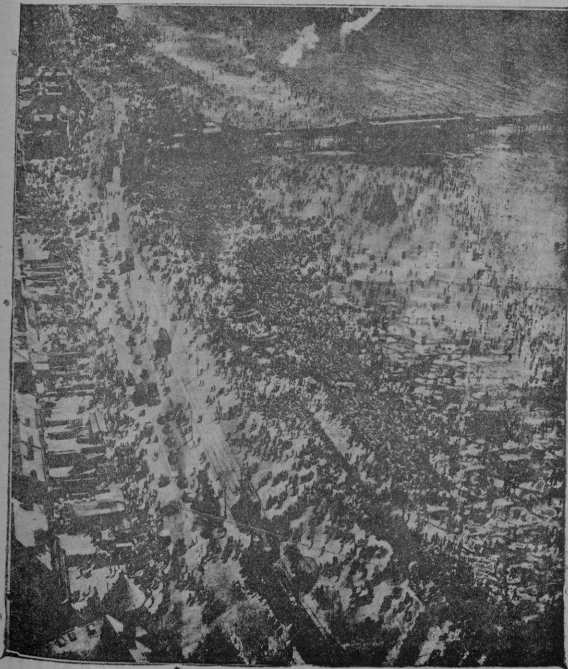
En esos días de calor bochornoso, que de más actualidad que esa fotografía de una playa de Lancashire, donde son a miles los que se zambullen en el agua, buscando un alivio a la ola de calor

Vino la guerra y salió mal. Alemania era tan fuerte que, aunque mal dirigida, no sucumbió hasta dejar agotados a sus vencedores. Fué aquella la derrota, no de los Imperios Cen-