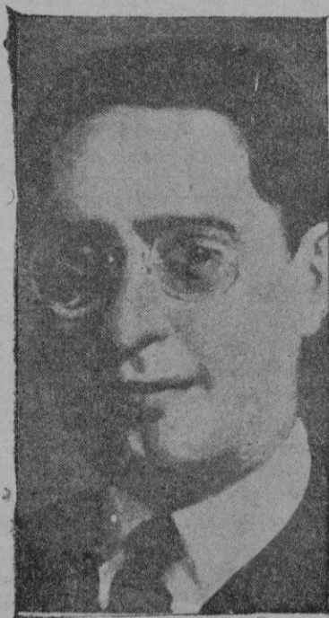
El ministro de Obras Públicas italiano, señor Luigi Razza, que pereció en el accidente de aviación ocurrido cuando se dirigía a Asmara, a quinientos kilómetros de El Cairo

Tiempo probable.—Inseguro y probabilidad de chubascos tormentosos.