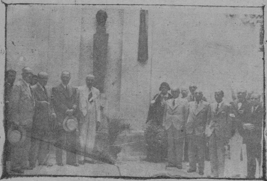
Las autoridades después del descubrimiento del busto de Russiñol

Parece que fué ayer, dijo, que se celebró la entrega de la testa de Rusiñol, por la Asociación per la Cultura de Mallorca, al Consistorio, y sin embargo ya pasaron muchos meses. Rusiñol, aunque catalán de nacimiento era mallorquín de corazón y es