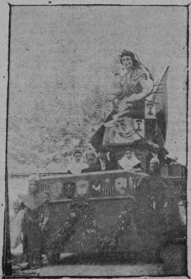
La carroza del Ayuntamiento de Palma. Proyecto del señor Aleñar

Todos de pronóstico leve, salvo complicaciones.