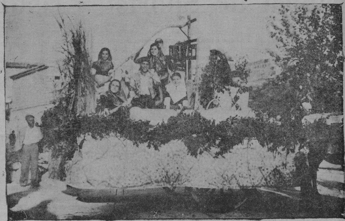
La celebrada carroza de Andraitx

A ambos lados de la matrona iban los maceros de este Excmo. Ayuntamiento y enfrente dos payesitas. Daban guardia a pié a la carroza con sus lanzas y vistosa indumentaria dos almogávares medioevales simbolizando la época popularizada en el drama "La campana de la Almudaina" quedando así representadas las diferen-