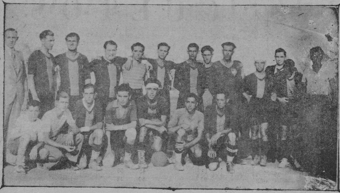
El Unión Sportiva de Mahón, con sus directivos y suplentes que jugó con el Baleares