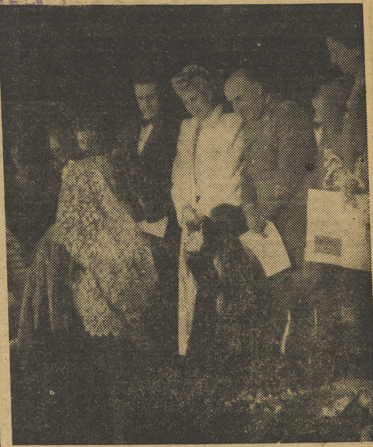
Instantánea obtenida en la plaza Mayor, de Madrid durante el homenaje que las provincias españolas rindieron a la embajadora de la Argentina, Doña María Eva Duarte de Perón, aparece, en la foto, junto a doña Carmen Polo de Franco y S. E. el Jefe del Estado, Generalísimo Franco.

Homenaje de las provincias españolas a doña María Eva Duarte de Perón