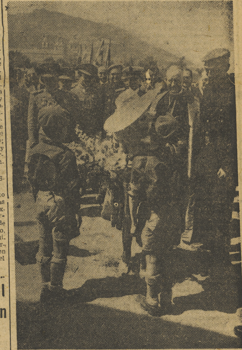
Un momento de la visita de doña Eva Duarte de Perón al campamento «Santa María del Buen Aire». La ilustre dama argentina besa a un niño que, en nombre de todos sus compañeros, le ofreció un ramo de flores.