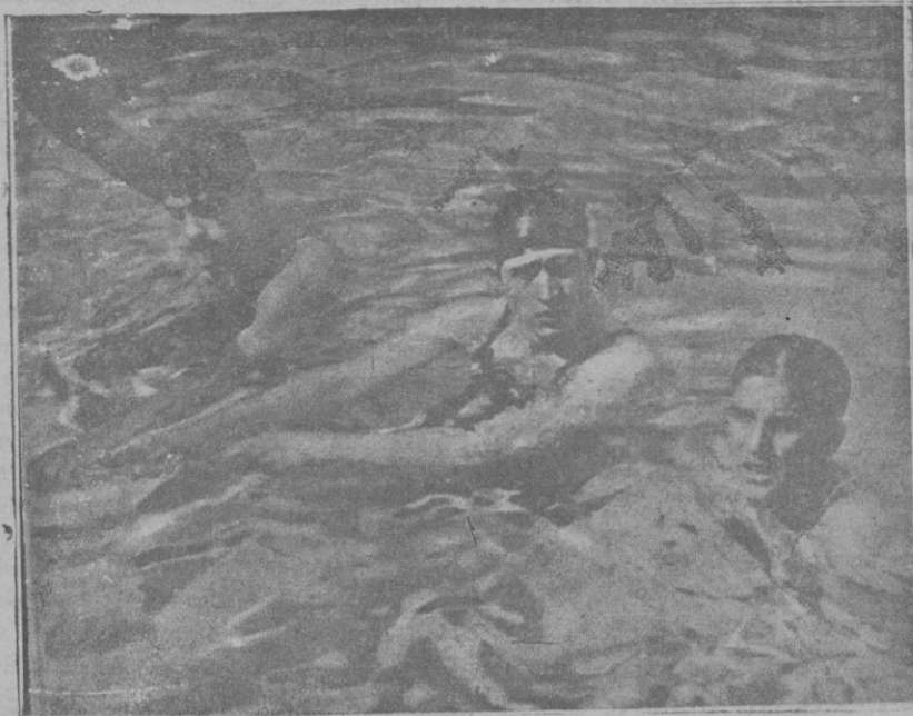
Paris. — En la piscina de Tourelles se ha celebrado un festival de natación en el que tomó parte Peter Fick, famoso nadador ameri- cano, que ha superado las marcas establecidas por Weissmüller, venciendo en la carrera de los cien metros libres en el tiempo de 58 segundos y seis décimas

No contestó. Me acerqué a él. Estaba fi- vido. Lo sacudí con fuerza.