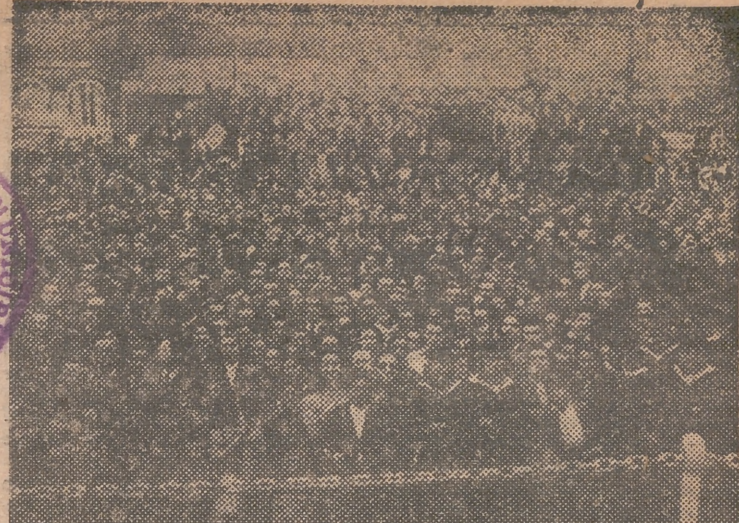
CADIZ. — Vista parcial del muelle del puerto de Cádiz, completamente abarrotado de público, que acudió a despedir a los marinos del «Argentina». — (Foto Cifra).