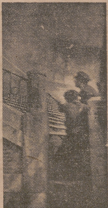
Los bomberos en una de las escaleras de la Plaza

funcionado con una impericia notoria y con falta de medios adecuados, provocando protestas entre el público que asistía, escandalizado ante la pasividad de los bomberos, que carecían en absoluto de medios. Puede decirse que hasta pasados tres cuartos de hora no ha empezado a caer agua sobre el verdadero fuego, pues no había manera de con-