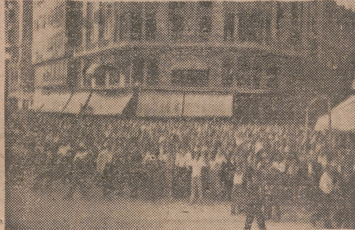
Una gran muchedumbre se ha congregado ante la Plaza