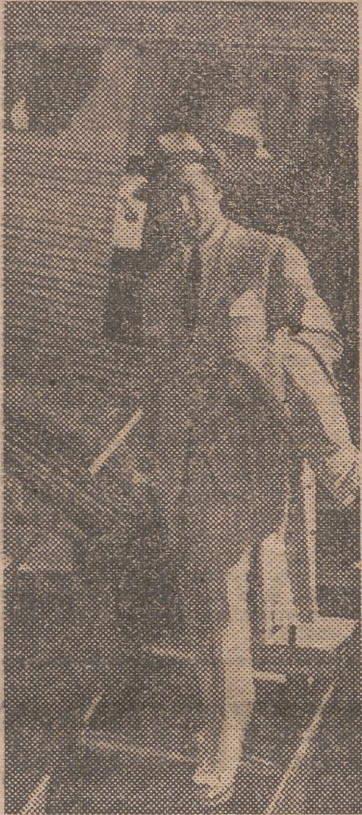
Esta mañana llegó Ara. Véanle descendiendo del avión, en el aeropuerto de Manises. De Manises, precisamente. Donde quizás le esperara ya el terrible «Tigre», a la puerta de su casa, haciendo «ganar» para la revancha.

CROUS SEGUROS DE ENFERMEDAD SEGUROS DE ACCIDENTES SEGUROS DE INCENDIOS SEGUROS DE VIDA COLON, 66. — TELEFONO 14.162