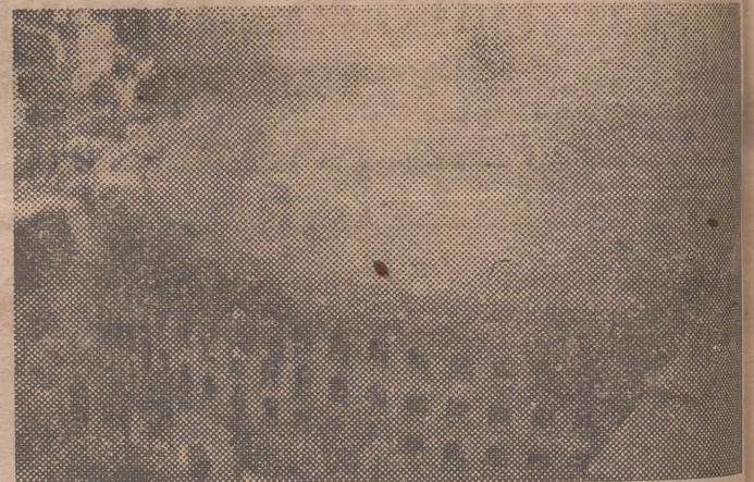
La Plaza, a vista de pájaro, durante el incendio

A las cinco, pasto de las llamas se derrumbó otra sección del cielo raso de la segunda naya, que se enfrenta con la calle de Colón.