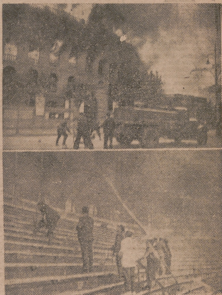
Dos aspectos del incendio y traslado que Valencia entera es del Servicio de Bomberos.

La Plaza de Toros valenciana ha quedado medio destruida. ¿Achacable al fuego? Más justo sería decir que al insuficientísimo y risible servicio municipal de bomberos que, como en ocasiones anteriores, ha actuado tarde y con deficiencias imperdonables. Una vez más, ha quedado demos-