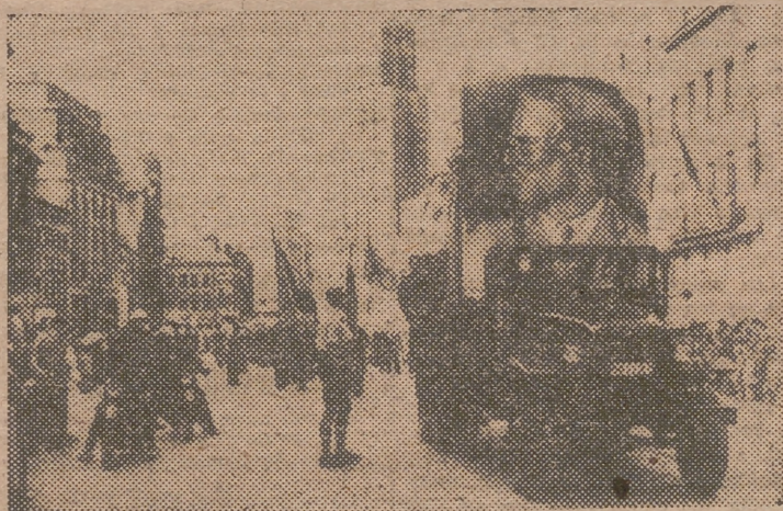
Una manifestación monstruo se celebró en Amberes el 15 de septiembre pasado, en la que millares de participantes, portando grandes retratos del rey Leopoldo, desfilaron por las calles pidiendo el regreso del monarca..