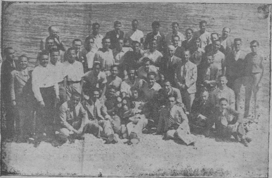
Grupo de asistentes al banquete celebrado en el Hotel Ca's Catalá, en honor de los jugadores del Athlético