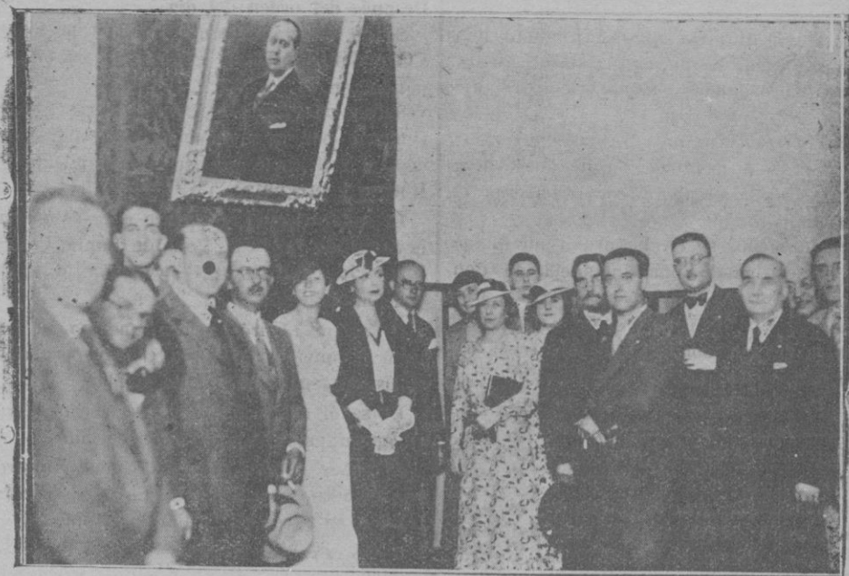
El cuadro de Gil Robles descubierto en el local social de Acción Popular Agraria.

El domingo por la noche, en el local social de Acción Popular Agraria de esta ciudad, se celebró el acto de descubrir el retrato del Jefe de la C.E.D.A. don José M.ª Gil Robles, acto al que se debía darse más solemnidad pero que, dadas las últimas disposiciones ministeriales prohibiendo