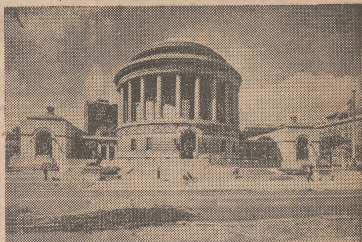
CHICAGO (Illinois). — Monumento erigido a orillas del lago Michigan, en honor de los 80.000 ex combatientes de la Orden Nacional de los Alces, que ha sido dedicado oficialmente el 8 de septiembre en presencia de unos 25.000 miembros.