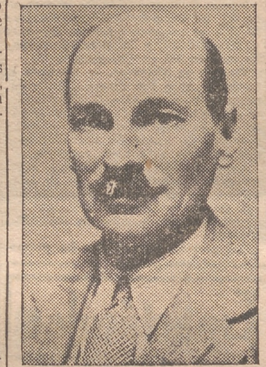
Attlee, «primer» británico

Tokio, 11. — Una manifestación de unas ocho mil personas se ha dirigido esta mañana ante el Palacio Imperial para exigir la repatriación de los japoneses de las zonas controladas por los rusos, a la mayor urgencia. — Efe.