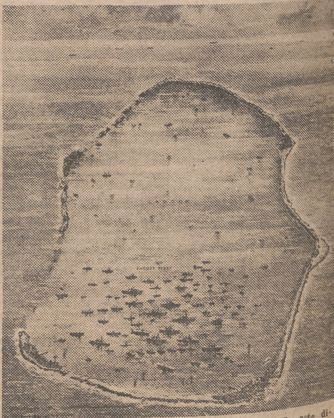
La revista inglesa «London News», ha publicado este dibujo del atolón de Bikini, con la flota que sirvió de blanco y en el fondo los buques que observaban la experiencia