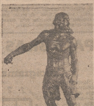
Ignacio Pinazo Martínez: «El saqueo»