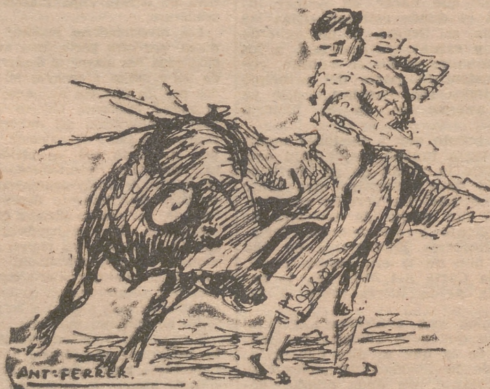
«Choni», saliendo de un molinete