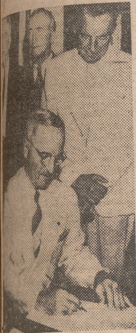
Truman firma el préstamo de 5.750 millones de dólares a Inglaterra. La fotografía muestra a Truman firmando el documento en la Casa Blanca, en presencia del secretario de Estado, Bynnes, y el embajador de Inglaterra, lord Averchapel.