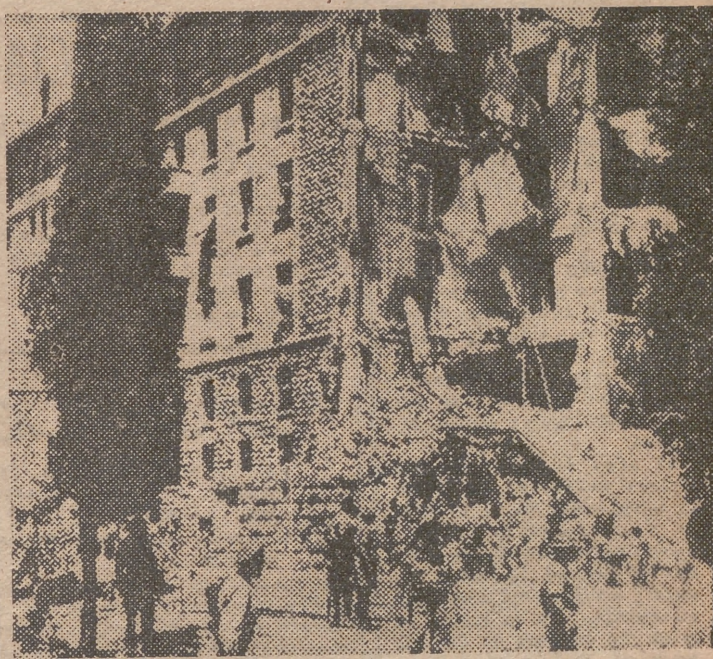
Vista parcial del Hotel Rey David, de Jerusalén, volado por los terroristas judíos.