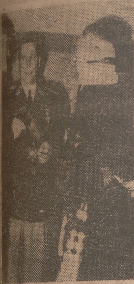
Fotografía obtenida de la visita del general Peron al crucero «Galicia». Acompañado al presidente, el almirante Moreno, y el embajador español, conde de Ballester, a la izquierda de la foto.

EL PRESIDENTE PERON, VISITA EL CRUCERO «GALICIA»