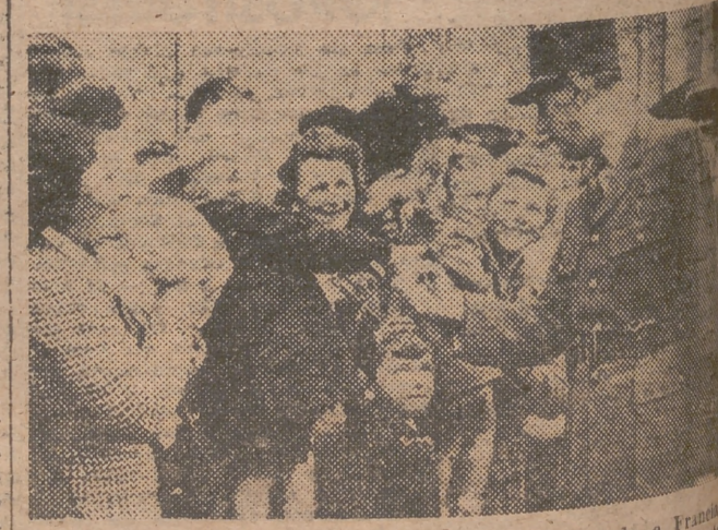
Para conmemorar el aniversario de su llegada a Francia en 1944, el general De Gaulle pronunció un importante discurso, en el que evocó el problema constitucional de la foto, el general francés saluda a los niños de Bayeux.