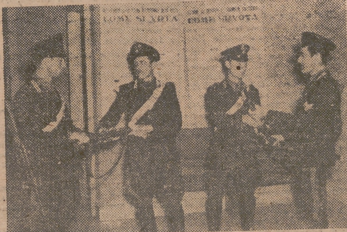
MILAN. — Dos «carabinieri» entregan sus fusiles antes de entrar en el colegio electoral para depositar sus votos. (Foto Cifra).