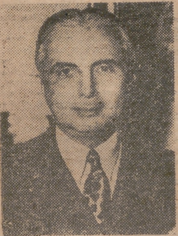
El doctor Mariano Ospina Pérez, presidente electo de Colombia, que tomará posesión de su cargo el día 7 de agosto.