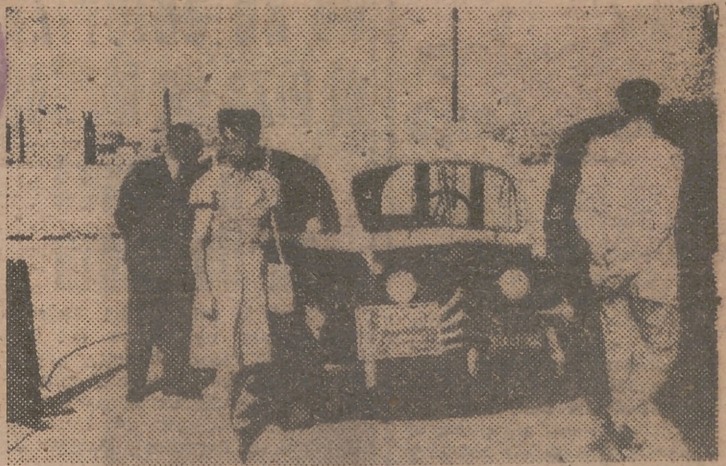
MADRID. — Actualmente se celebra, en la terraza del Parque Móvil de Ministerios Civiles, la anunciada exposición de automóviles eléctricos. En la foto, el público examina, con curiosidad, los coches expuestos.