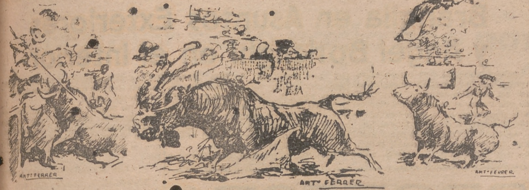
Un puñazo de un reserva

timoros. Pronóstico grave, Doctor Serra. PESO DE LOS NOVILLOS 213, 253, 241, 267, 250 y 241.