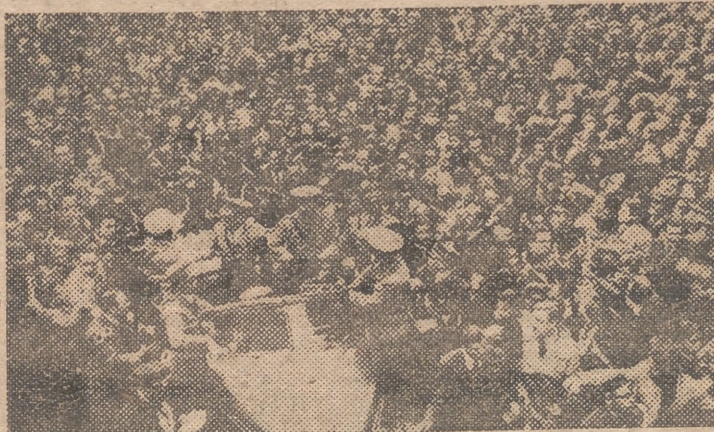
El jefe del Estado, general Carmona, es aclamado por la multitud a su llegada a Lisboa.