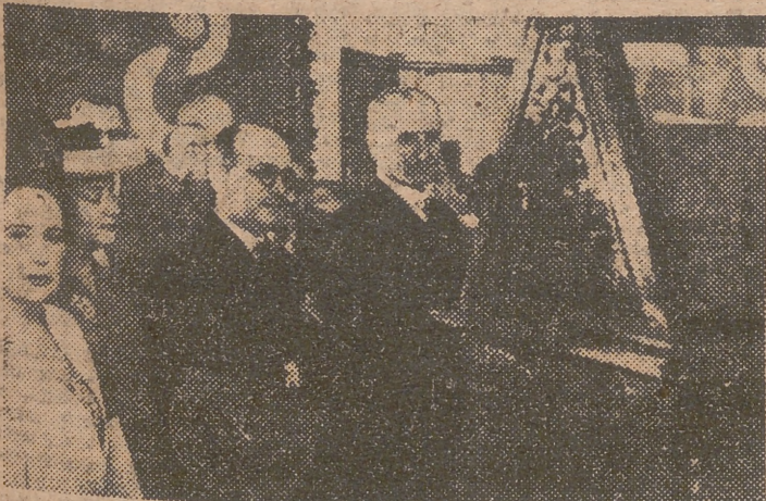
SEVILLA. — El ministro de Educación con las personalidades que acudieron a la inauguración de la Exposición del Libro Nebriicense en la Biblioteca Universitaria de Sevilla.