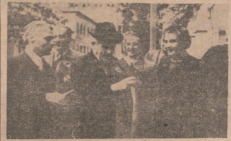
El célebre músico italiano Arturo Toscanini, llega a su casa de la Via Durini, en Milán, por primera vez en 16 años, acompañado de sus hijos Walter y la condesa Wally Castelbarce (izquierda y derecha del maestro, respectivamente).