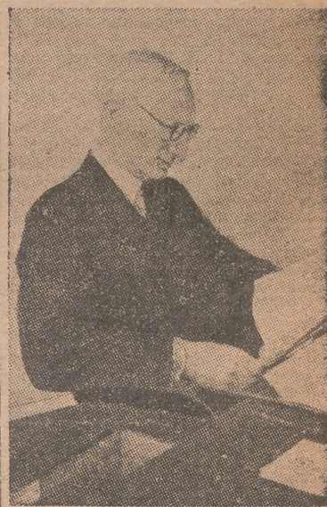
SIR WILLIAM BEVERIDGE

gran relieve que es nombrado director de la Escuela de Ciencias Económicas de Londres y más tarde presidente de la Real Sociedad Geográfica. Ingresó en el partido liberal y fue elegido diputado. Intenta que se convierta en ley su plan de Seguro Social; pero, aunque aceptado en principio por