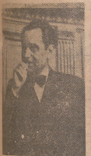
La foto muestra una actitud del criminal, acusado de 63 crímenes.