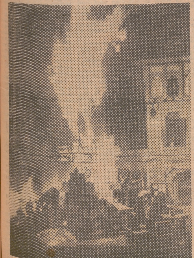
Quema de la falla de la Plaza del Mercado.