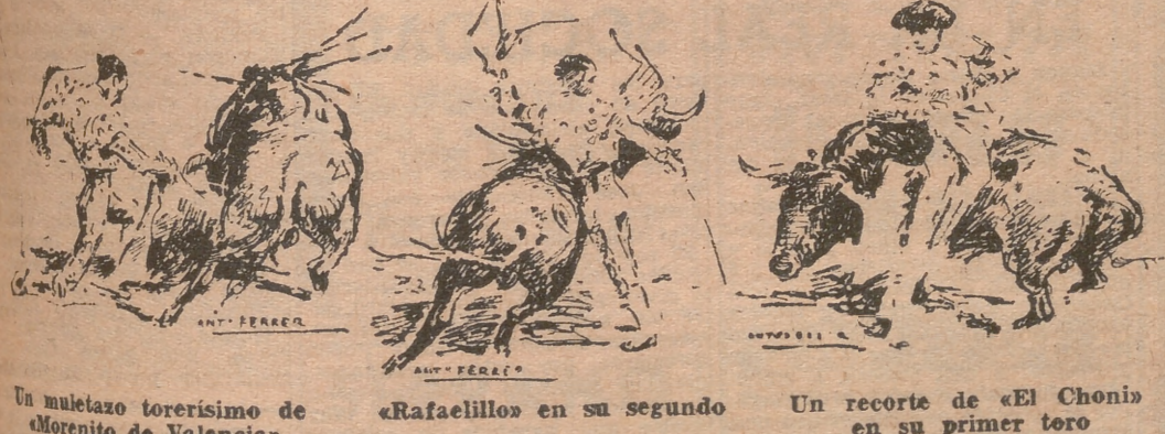
Un muletazo torerísimo de «Morenito de Valencia»

HORIZONTALES: 1.—COCO. PASAR. 2.—ADAR. ACUSE. 3.—ZIRAC. PUYAS. 4.—OSA. ATA. SOSO. 5.—SABATINA. 6.—OCA. LADO. 7.—EDITO. RES. 8.—ABETUNA. IDO. 9.—NAMOR. SEGUN. 10.—ATINA. SECA. 11.—LELAS. ANAR. VERTICALES: 1.—CAZOS. CANAL. 2.—ODISA. BATE. 3.—CARABO. EMIL. 4.—ORA. ACETONA. 5.—CATADURAS. 6.—TILIN. 7.—PAPANATAS. 8.—ACUSADO. ESA. 9.—SUYO. ORIGEN. 10.—ASAS. EDUCA. 11.—RESOC. SO-NAR.