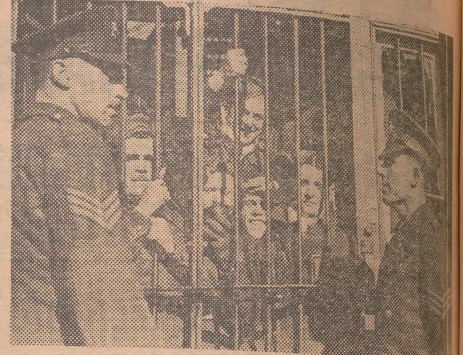
El 23 de febrero los presos de la cárcel militar británica de Aldershot, se sublevaron. Después de reducir a la impotencia a sus guardianes, provocaron numerosos destrozos en el edificio y luego lo incendiaron poco antes de entregarse, al día siguiente por la tarde. He aquí un grupo de amotinados después de ser encerrados nuevamente.