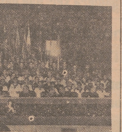
Presidencia del acto de esta mañana en Apolo, organizado por el F. J., con asistencia de varias jerarquías nacionales.

no por sus doctrinas — que desconoce — ni por sus hombres, sino por que es un centro vital, un nudo de ilusiones. Hoy estas ilusiones se ven por fortuna encarnadas en nuestro Caudillo que es el símbolo de aquellos reyes caudillos que dieron pá-