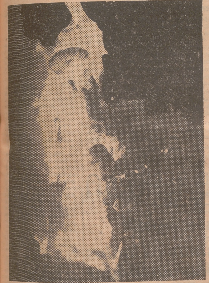
Quema de la falla del «Só Quelo»