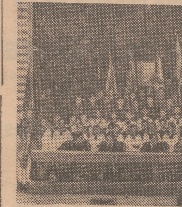
Presidencia del acto de esta mañana en Apolo, organizado por el F. J., con asistencia de varias jerarquías nacionales.

que era la última del programa, pero no la última en el tiempo. Habló del falseado concepto del campo a través de cierta literatura, concepto que había que reivindicar tanto más cuanto muchos de los que escribieron y hablaron no habían