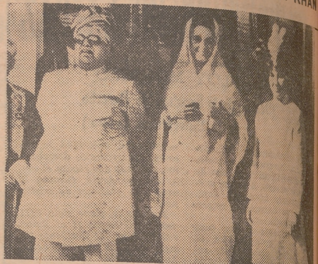
El Aga Khan se dispone a pesarse con diamantes en el Stadium de Bombay, ante una muchedumbre de setenta mil personas.