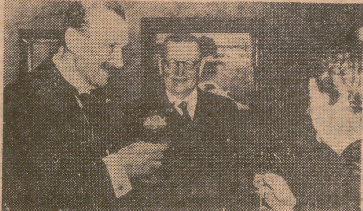
El mariscal Mannerheim brinda con el nuevo presidente de Finlandia, Juho Paasikivi, y su esposa, por el feliz mandato del segundo.