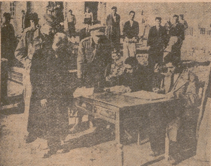
Campesinos iraníes reciben el precio de sus granos en un puesto recolector británico en el Irán, durante la pasada contienda.