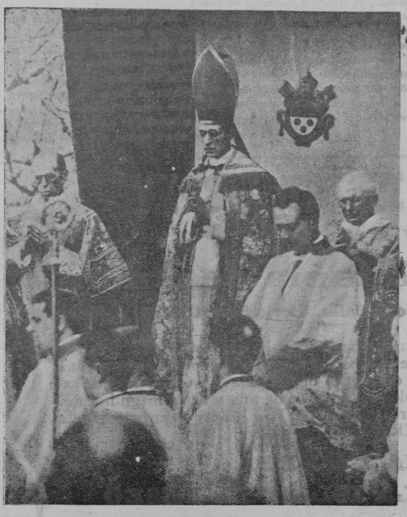
Lourdes. — La solemne misa pontifical con que terminó el Triduo de la Paz fué celebrada por el legado del Papa, monseñor Pacelli.

La prensa de Barcelona llegada a Palma publica el siguiente telegrama de Madrid: "Siguen haciéndose los preparativos para la reorganización del capital del Crédito Balear, mediante la cual volverá a actuar esta entidad. Como ya tenemos indicado en alguna otra ocasión, se ofrecerá a la entidad una aportación de capital fresco de dos millones de pesetas en acciones preferentes. Habrá una segunda aportación, que afectará al capital de "roulement". Estos nuevos doce millones de pesetas se dedicarán a pagar el 20 por ciento de los créditos de la clientela, que ya está dispuesta a aceptar esta fórmula. Desde luego, esos créditos solamente se cobrarán así. El 80 por ciento restante quedará a reserva de que el negocio entre en renta nuevamente. Se irán haciendo efectivos llegado ese momento y una vez se reserve a las acciones preferentes un 7 por ciento de dividendo. Como es sabido, el grupo bancario que entrará a realizar esta fórmula se encuentra formado por el Banco Central, Banco Hispano Colonial, Banco Urquijo Catalán, Mercantil e Industrial. También el Banco de España se encuentra muy dispuesto a colaborar en la realización de este intento de flotación de esa entidad balear. Entre los elementos bancarios se habla sobre este particular con interés. La impresión en general es buena, diciéndose que, según el durísimo informe que cier-