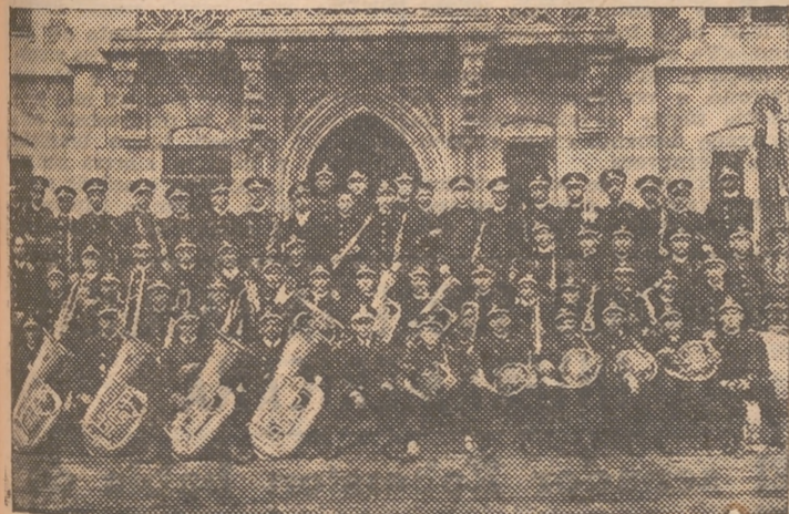
LA BANDA UNION MUSICAL, DE LIRIA