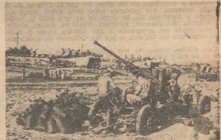
Los servidores de un cañón antiaéreo australiano se mantienen, en constante alerta, en una playa de la isla de Borneo