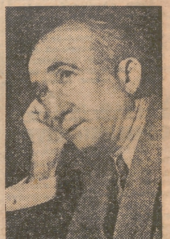
James F. Byrnes