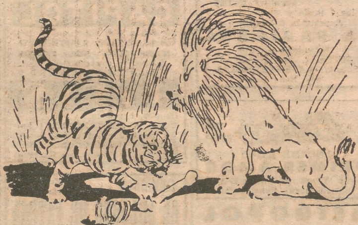
—¿Qué has hecho del explorador, de su mujer y de su hija? —Los he «depurado».