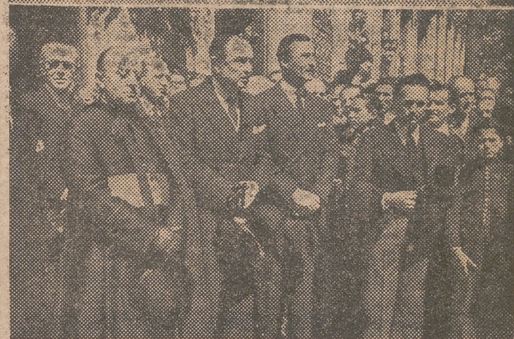
Traslado de los restos mortales del embajador plenipotenciario del Gobierno provisional francés en España, señor Truelle, desde la embajada a la estación de Atocha, desde donde fueron conducidos a Francia. Al acto asistieron los ministros de Asuntos Exteriores y Agricultura y otras jerarquías.