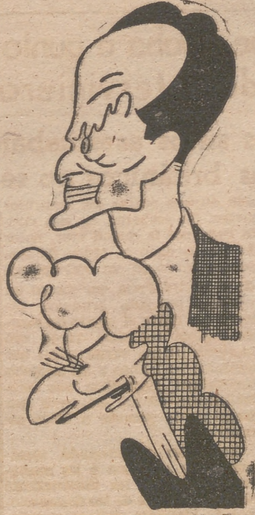
Rafael Rivelles y Conchita Montijano, intérpretes de «Gente de arriba»

tica, del más elevado estilo, se puso anoche de manifiesto, y su éxito es, pues, doblemente elogiable. Bien Conchita Montijano en un papel de poco relieve. Lo mismo que Irene Más —¡qué difícil tipo le to-