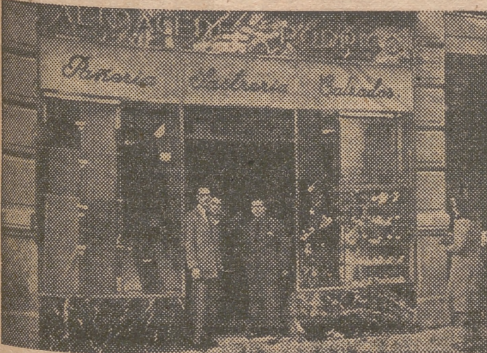
Fachada del nuevo establecimiento que inauguró ayer la importante firma Rodrigo.

Un numeroso y distinguido público acudió al acto de la bendición de las nuevas dependencias, que fué oficiada por el Padre Manuel Fortea, rector del Colegio Mayor Universitario Hispano de San Vicente Ferrer (Padres Dominicos).