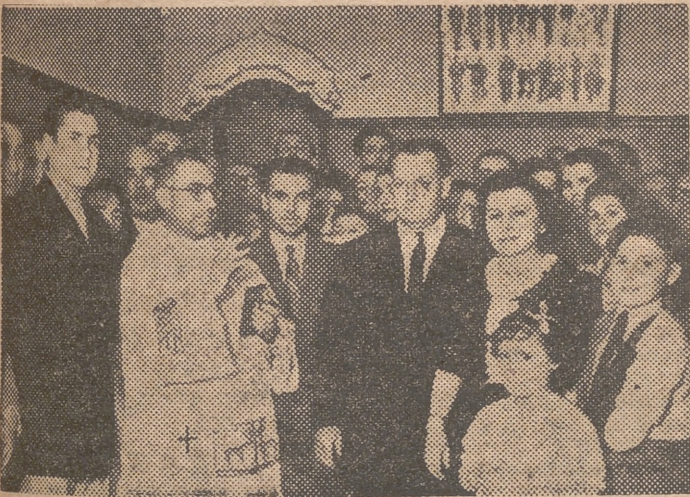
Un momento de la bendición de los establecimientos Rodrigo, que fueron inaugurados ayer tarde