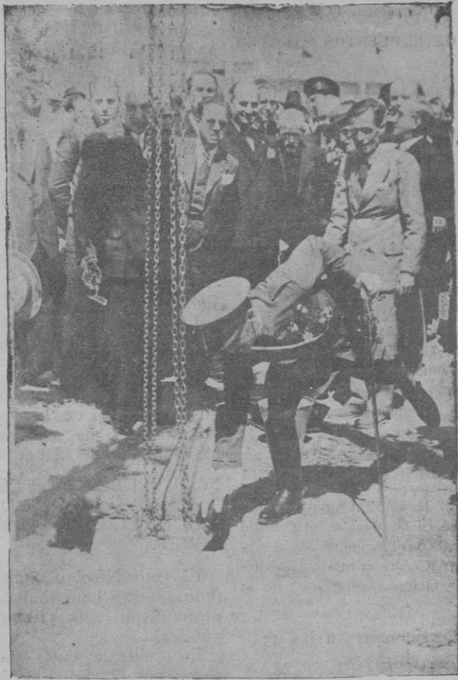
Colocación de la primera piedra del grupo escolar "Jaime I". — El Comandante Militar Sr. Goded, poniendo una paletada a la primera piedra, como hicieron el Gobernador Civil y el Alcalde de Palma.